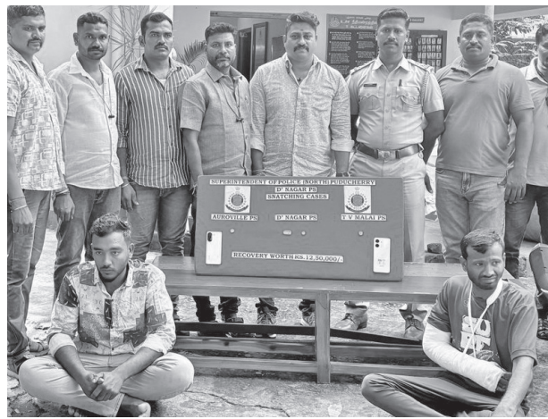
கைதான கொள்ளையர்கள் 2 பேரை படத்தில் காணலாம்.